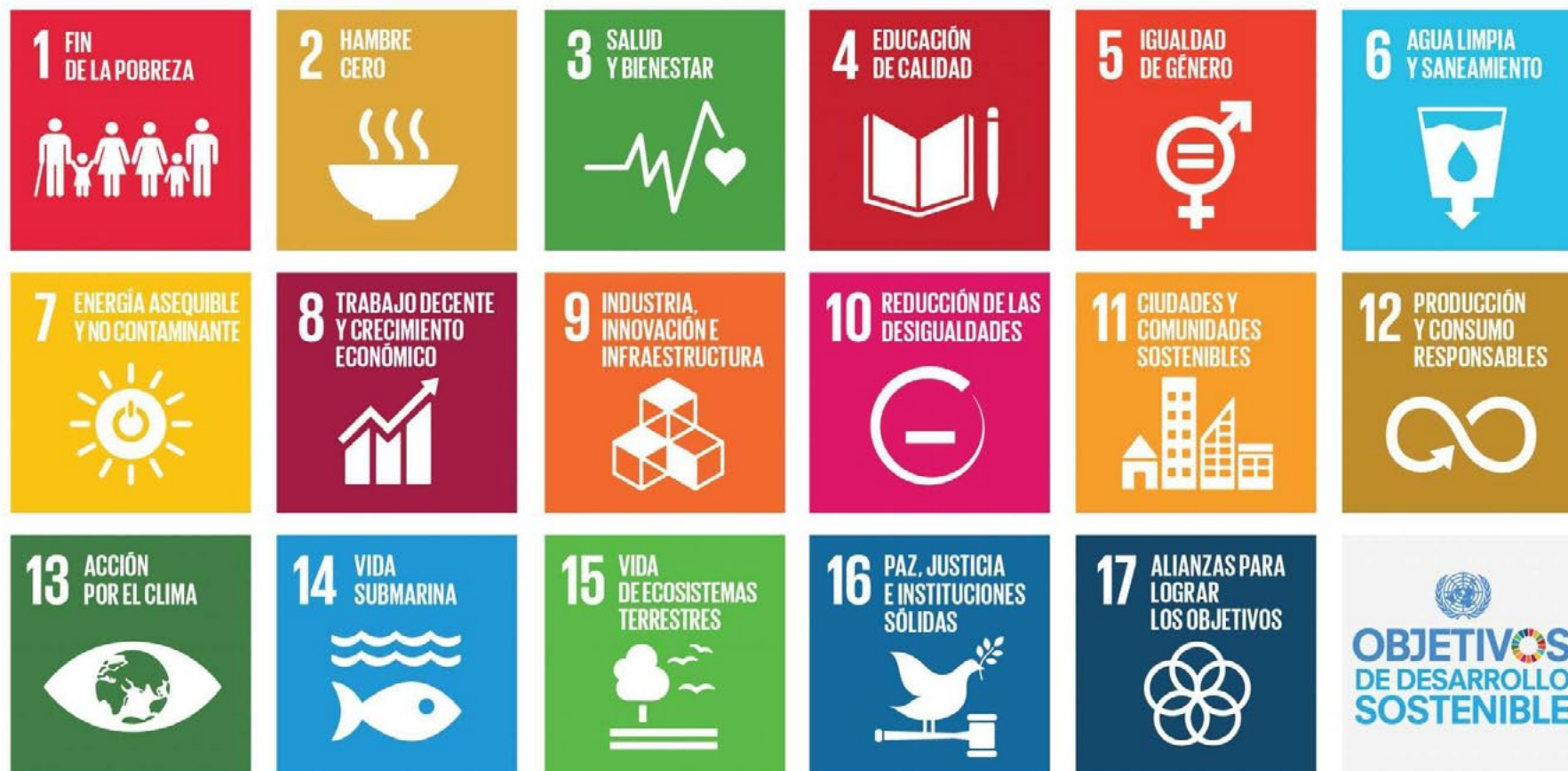
Ilustración 1: Objetivos de desarrollo sostenible; Fuente: NNUU.