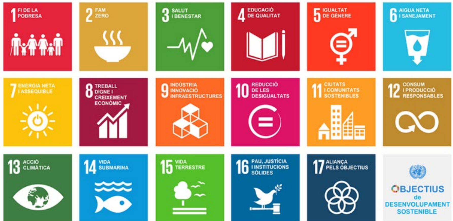
Il·lustració 1: Objectius de Desenvolupament Sostenible; Font: ONU.